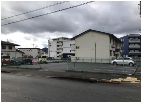
けやきマンション側